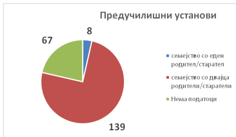
Графички приказ 1

Од овој графички приказ може да се забележи дека децата коишто беа предмет на ова истражување во најголем број или 139 деца живеат во семејство со двајца родители. За 67 деца нема информација за семејната состојба за децата, додека 8 деца живеат во семејство со еден родител/старател.