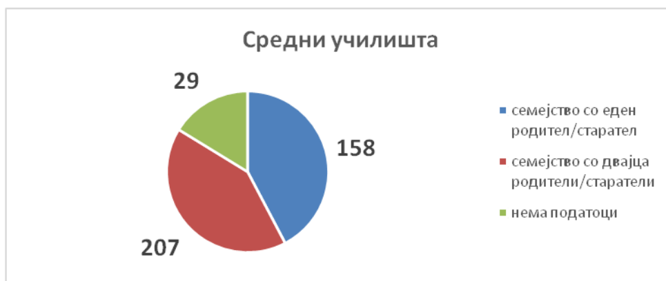
Графички приказ бр. 3

Од податоците, најголем број деца Роми, коишто се вклучени во средното образование, или 207, потекнуваат од семејство со двајца родители, потоа 158 деца потекнуваат од семејство со еден родител и за 29 деца не е позната семејната состојба.